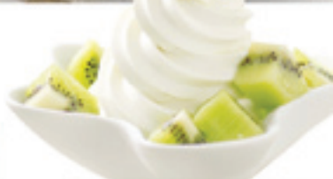
Súper Sprint de Yogurt Griego

PreGel MEXICO | Tel: 33.3673.5773 | Gratis: 01.800.750.1010