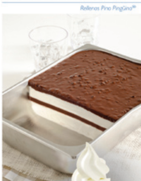
Rellenas Pro Pinguino®

Conoce nuestros conceptos innovadores en el stand #1007.