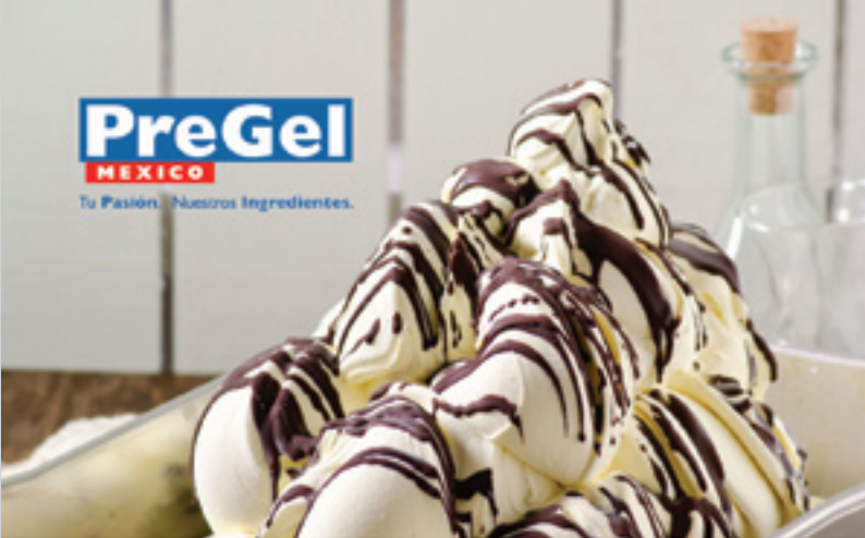
Gelato de Vanilla Strocciatella con Base Stevia PreGel